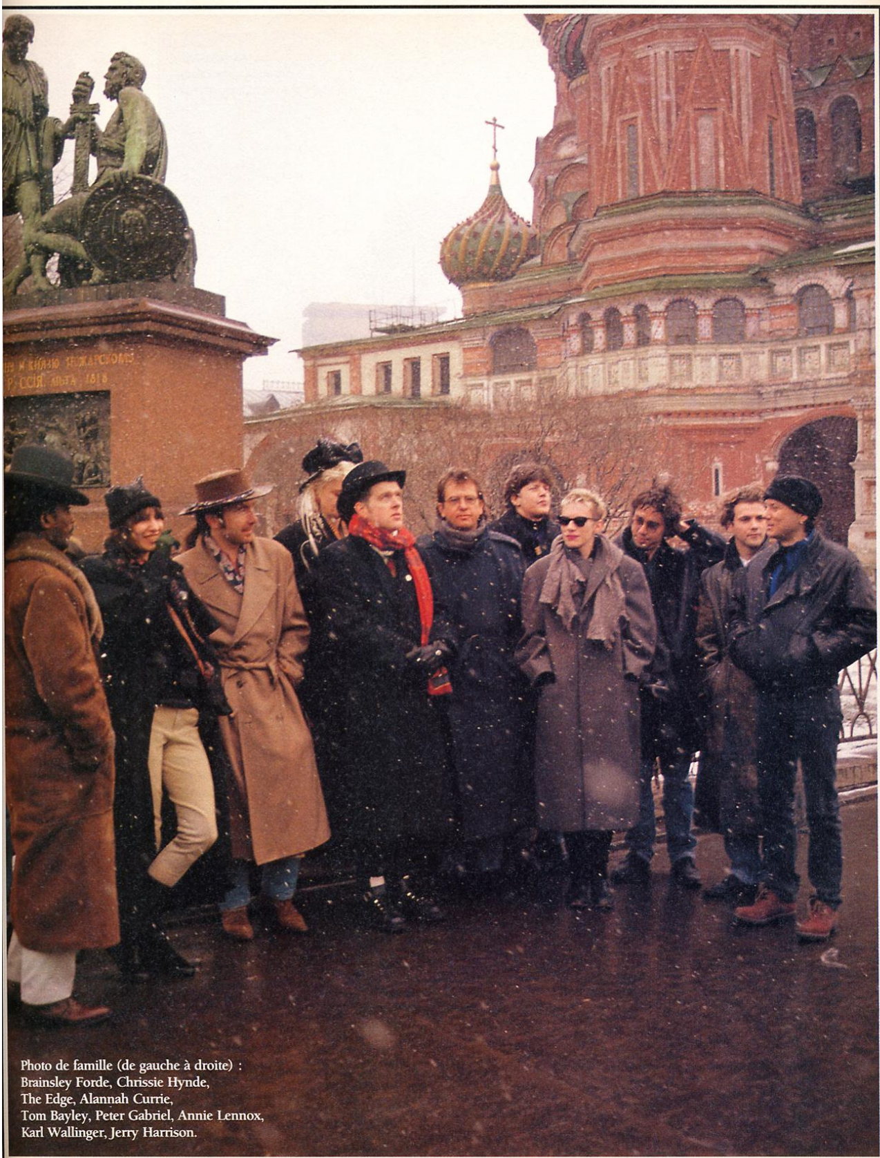
Photo de famille (de gauche à droite) : Brainsley Forde, Chrissie Hynde, The Edge, Alannah Currie, Tom Bayley, Peter Gabriel, Annie Lennox, Karl Wallinger, Jerry Harrison.